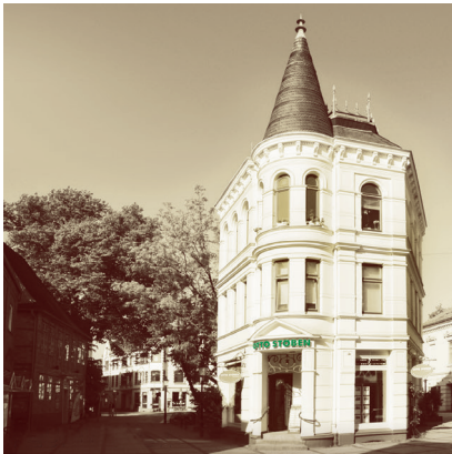
BÜRO NEUMÜNSTER Mühlenbrücke 8

Im Herzen Schleswig-Holsteins liegt, verkehrsgünstig und zentral, unser Regionalbüro Neumünster an der Mühlenbrücke 8.